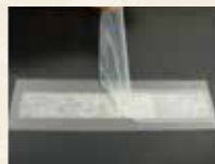
シリコン+PET (両面テープで接着)

GAS Glass Primer は、金属や樹脂は勿論、ガラス、シリコンゴム、セラミックなど、様々な素材に対して使用可能です。また、塗装・接着・印刷と様々な場面で利用できます。