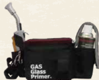
GAS Glass Primer.-X