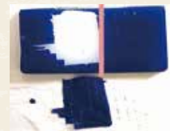
TPO+ウレタン塗装の密着試験