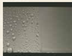
アルミの親水性確認